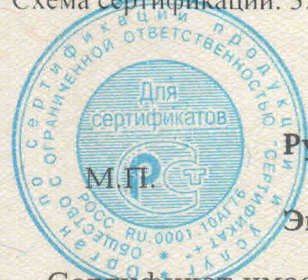
Схема сертификации: 3.